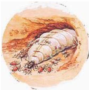
Bild 2 (vergrößerter Ausschnitt aus Bild 1): Die Termitenkönigin ist das einzige fruchtbare Weibchen einer Termiten-Kolonie. Sie legt alle drei bis vier Sekunden ein Ei, ihr Leben lang.

Bild 1: Die Klimaanlage der Termitenfestung: Die äußerlich sichtbaren Kühltürme werden von Lüftungsschächten durchzogen, durch die die Luft nach unten in die Kellergewölbe streicht. Von hier aus wird das gesamte Nest belüftet. Durch Erweitern oder Verengen der Schächte regulieren die Tiere die Temperatur so, dass in der Kammer der Königin im Zentrum der Festung die Idealtemperatur von 30 Grad Celsius exakt aufrechterhalten wird.