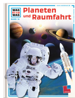
WAS IST WAS Band 16 Planeten und Raumfahrt ab 8 Jahren mit vielen Fotos, Illustrationen und Infokästen HC, 48 Seiten, 20,8 x 27,8 cm € [D] 9,95 / € [A] 9,95 / sFr 14,90 ISBN: 978-3-7886-0256-7

Balea Dusche & Shampoo for Kids ist ab sofort in allen mehr als 1.200 dm-Märkten erhältlich.